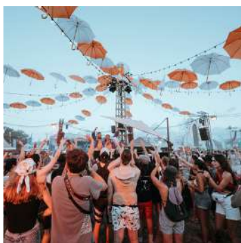
Le Tremplin Artistique

Les programmes annuels sont l'occasion de rencontrer la jeunesse tout au long de l'année sur ces thèmes et de sensibiliser notre public à ces enjeux d'intérêt général.