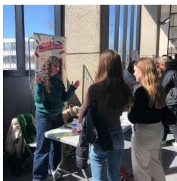
La Campagne Proto