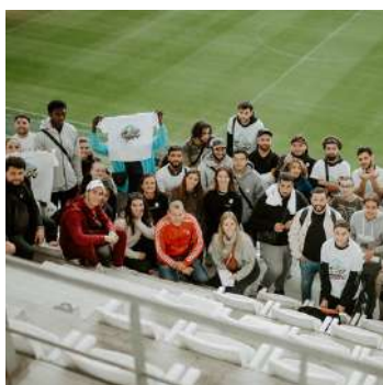
La Passe D'