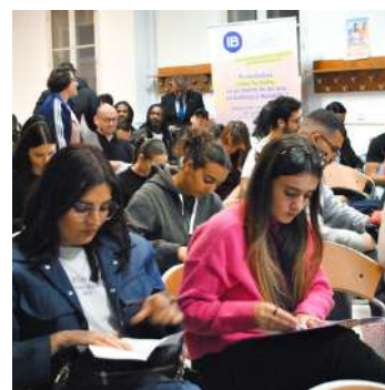
Invest in Me