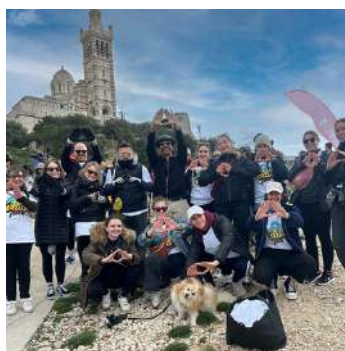
La Delta Family